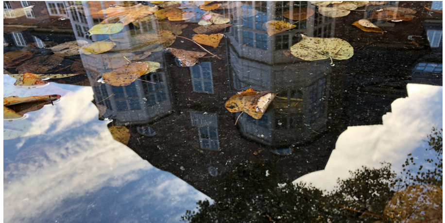
Abb. 2: Campusgebäude in einer Pfütze widergespiegelt

sitzend bleibt man mehr oder weniger anonym. Trotzdem genießen wir ein enormes Privileg, in einer Zeit zu leben, in der eine global wütende Viruspandemie durch die digitalen Möglichkeiten erträglicher gemacht werden kann. Während meines Freiwilligendienstes in Costa Rica zu Beginn des Jahres musste ich nämlich anerkennen, dass vielen Menschen durch das Ausbleiben des Präsenzunterrichtes schlicht und ergreifend der Zugang zu irgendeiner Form von Bildung komplett abgeschnitten wird. Da will ich mich nicht dann doch nicht mehr beklagen, sondern lieber fröhlich in die Kamera lächeln.