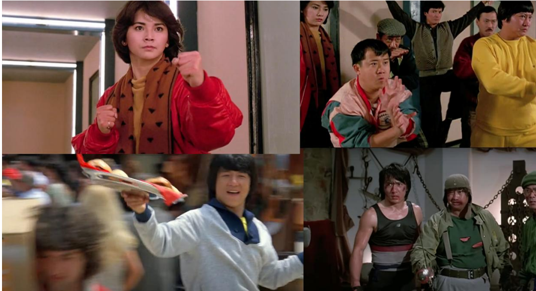
Abb. 22: Kostüme in "Twinkle Twinkle Lucky Stars" (oben) und "Wheels on Meals" (unten)

Im Laufe der Vorbereitung kamen mir außerdem einige Ideen, um die Verbindung zum Hong-Kong-Action-Kino noch eindeutiger zu machen. Eine meiner Favoriten war der Versuch, den Film zum Großteil neu zu synchronisieren und auffällig nachzuvertonen, um ihm eine "Ästhetik der Übersetzung" zu verleihen. Kung-Fu-Filme wurden zumeist in Kantonesisch gedreht und dann für den weiteren chinesischen Markt auf Mandarin übersetzt. Mit dem globalen Erfolg des Genres wurde Synchronisation und Untertitelung nur noch bedeutender und ein enormer Teil der Kung-Fu-Fans entdeckte diese Filme in einer übersetzten Form. Deshalb wollte ich versuchen, einen ähnlichen Effekt zu erzielen und mich dabei hoffentlich gleichzeitig dazu bringen, die zusätzlich Sprache durch Bewegungen zu betonen. Das heißt auch, dass ich mir in der Planung bewusst war, dass wir unsere Dialoge für die Neuvertonung leicht ändern müssen, um den gewünschten Effekt zu erzielen. Ziel ist dabei also eine auffallende Asynchronität zwischen Mundbewegungen und dem Ton der Stimmen.