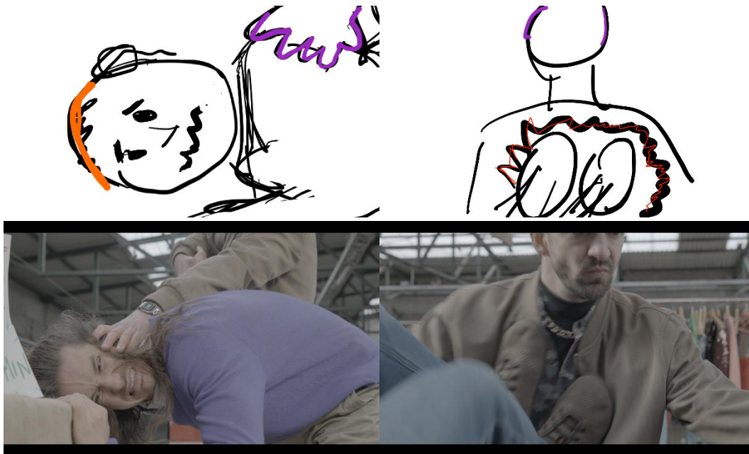
Abb. 18: Vergleich Storyboard (oben) zu Filmszene (unten)

Ab Januar probten wir jede Woche an einzelnen Stunts und Bewegungsabläufen. Wir testeten Kamerawinkel und Elemente wie Zooms und Shot-Länge für alle Stunts und Kampfsituationen. Ein besonderes Augenmerk legten wir auf der dramatischen Wirkung einzelner Bewegungen. Dabei war es uns gleichzeitig immer ein Ziel, dem Kampf einen klaren Rhythmus zu geben, der nach dem “pause/burst/pause”-Schema funktioniert und stetig Spannung aufbaut.