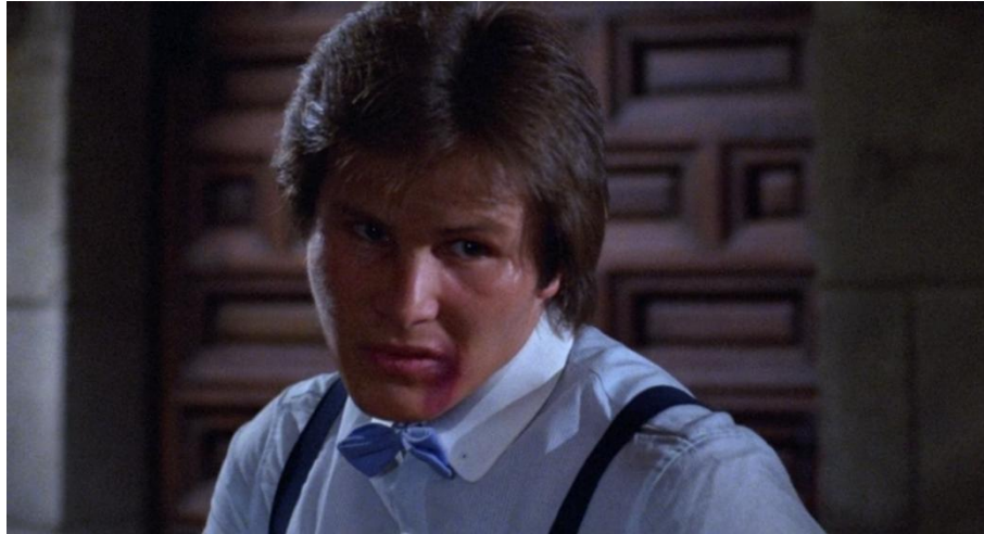
Abb. 9: Handlanger (Benny Urquidez) ist blutig und angeschwollen

angespannt er am ganzen Körper ist. Sogar seine Zähne beißt er sehr sichtbar zusammen und unterstützt damit die Geste der vor sich zusammengepressten Fäuste.