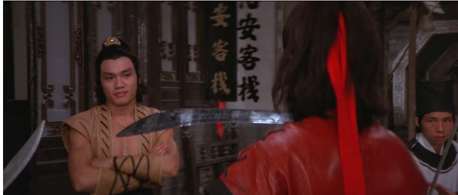
Abb. 2: „Tausendfüßler“ bedroht Tao Li mit einem Schwert

Ein schneller Zoom-Out enthüllt den Rest der Szene: „Kröte“ steht mit verschränkten Armen vor seinem Rivalen „Tausendfüßler“, der komplett in Rot gekleidet ist – in Anlehnung an den giftigen Chinesischen Rotkopf-Tausendfüßler. Obwohl „Tausendfüßler“ ein glänzendes, breites Schwert gezückt hat, strahlt „Kröte“ weiterhin Ruhe aus und trägt nur ein leichtes Lächeln auf dem Gesicht. Seine Augen ruhen auf Schlange. Nach dem Zoom wird auch erneut deutlich, wie viel der ausgeprägten Muskeln von „Kröte“ zu sehen ist, weil er nur eine leichte Weste trägt. Zum einen deutet der Moment darauf hin, wie sehr „Kröte“ seinen Körper trainiert und gehärtet haben muss, zum anderen spricht auch diese Bekleidung von großer Selbstsicherheit. Auffällig ist an dieser Stelle auch, wie wichtig auffällige und unterschiedliche Kostümierung für die visuelle Präsentation im Kung-Fu-Film ist. Zuschauende müssen in der Lage sein, zwei Charaktere innerhalb kürzester Zeit zu unterscheiden, selbst wenn diese sich rasant bewegen. In dieser Szene wird das erreicht durch den starken Farbkontrast von Rot und Hellbraun und einem Staging, das „Kröte“ und „Tausendfüßler“ jeweils deutlich von ihrem Hintergrund abhebt.