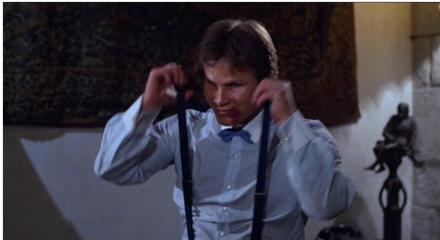
Abb. 12: Der Handlanger knallt mit den Hosenträgern

Jackie Chans Charakter Thomas deshalb gewinnen kann, weil er wieder aufsteht. Auffällig ist hier auch, wie klar dieser Film sich den von Bordwell beschriebenen pause/burst/pause-Rhythmus verfolgt. Kleine Unterbrechungen wie dieser Moment auf dem Sessel eignen sich ideal, um Spannung aufrecht zu erhalten und das Publikum auf den nächsten Schlag warten zu lassen.