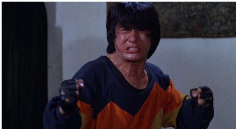
Abb. 8: Thomas spannt seinen Körper an im Kampf mit dem Handlanger

Im Finale des Films müssen die drei Helden in eine Burg einbrechen und gegen einige Handlanger kämpfen, um ihre Freundin Sylvia und deren Mutter aus den Fängen von Mondale zu befreien. In einem der beeindruckendsten Kämpfe tritt Jackie Chan gegen den professionellen Kampfkünstler Benny "The Jet" Urquidez an. Anhand dieser Kampfszene lassen sich einige der erwähnten Techniken, wie Action in den 80er-Jahren in Hong Kong gedreht wurde, sehr gut beobachten.