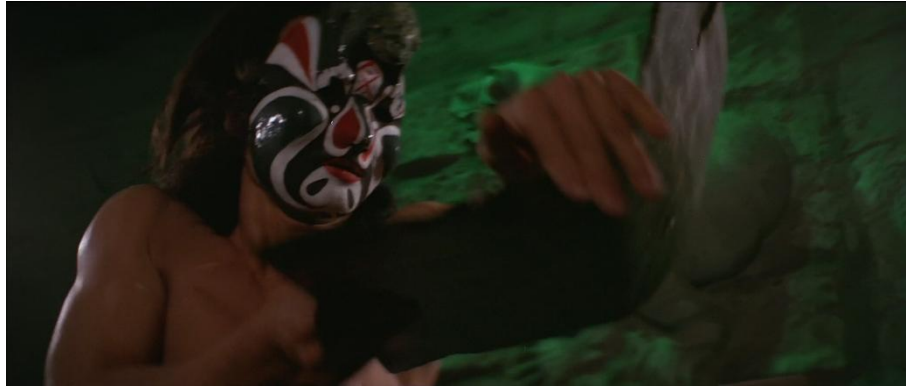
Abb. 5: Flashback zu Trainingssequenz, "Kröte" biegt metallene Platte

Der Rhythmus wird unterbrochen, für einen kurzen Moment schneiden wir zu der anfänglichen Demonstration der Techniken der fünf legendären Kämpfer. Oberkörperfrei und maskiert demonstriert „Kröte“ einen Schlag, der eine stählerne Platte mit Leichtigkeit verbiegt. Die Assoziation ist eindeutig – der Körper dieses Kämpfers ist zu übermenschlicher Härte trainiert.