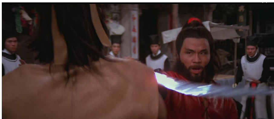
Abb. 4: "Tausendfüßler" schwingt Schwert während Beamte zusehen

Der „Tausendfüßler“ weicht vor dieser Aussicht zurück und wirkt zunächst verunsichert, aber wirft dann ruckartig sein Schwert hoch und schnell damit in Richtung seines Gegners. Hier lässt sich das von Eisenstein erkannte “recoil”-Prinzip gut beobachten, bei dem eine Bewegung mit einer zurückschnellenden “Ankündigung” verbunden und dadurch klarer kommuniziert werden kann.