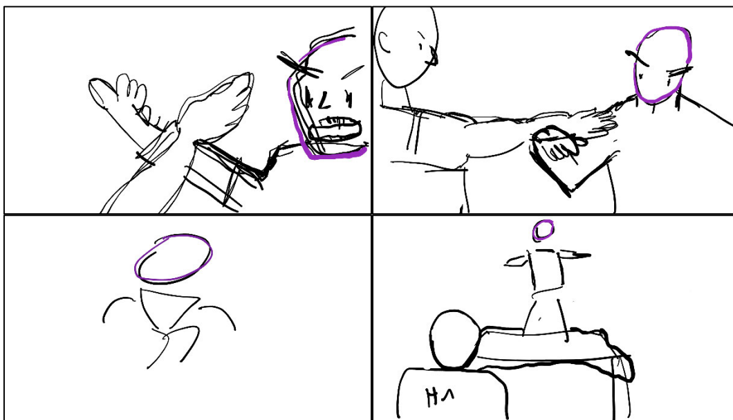
Abb. 17: Frühes Storyboard

In meinem ersten Storyboard finden sich bereits viele der Bewegungen und Situationen, die Teils des finalen Films wurden. Ich ließ mich hier vor allem von besonders ikonischen Momenten beeinflussen, die mir bei der Recherche aufgefallen waren. Hier habe ich beispielweise einen Kampf aus Pedicab Driver (1989), bei dem Sammo Hungs Charakter in einer Bar gegen einen alten Kampfsportmeister antritt, genauer analysiert. Ich versuchte vor allem zu erfassen, wie man explosive Action auf kleinem Raum am besten umsetzt. Auch die besonders spitz angewinkelte Kameraführung, der konstruktive Schnitt und das Experimentieren mit Point-of-View-Einstellungen haben mich für meinen Film inspiriert.