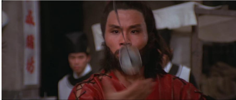
Abb. 3: "Tausendfüßler" wirft sein Schwert in die Luft

Der „Tausendfüßler“ weicht vor dieser Aussicht zurück und wirkt zunächst verunsichert, aber wirft dann ruckartig sein Schwert hoch und schnell damit in Richtung seines Gegners. Hier lässt sich das von Eisenstein erkannte “recoil”-Prinzip gut beobachten, bei dem eine Bewegung mit einer zurückschnellenden “Ankündigung” verbunden und dadurch klarer kommuniziert werden kann.