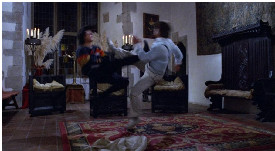
Abb. 14: Die Kämpfer treffen sich gegenseitig mit einem Tritt in der Luft

Thomas erhebt sich, reißt dabei seine Augen weit auf und lässt seinen Gegner nicht aus dem Blick. Hier finden wir ein gutes Beispiel dafür, wie die Kameraführung einen expressiven Gesichtsausdruck und eine angespannte Körperhaltung zusätzlich unterstreichen kann. Während sich Jackie Chans Charakter in diesem Moment aufrichtet, folgt die Handkamera exakt der Bewegung von seinem Körper und richtet sich aus, um ihn an der gleichen Stelle im Bildrahmen zu positionieren, mittig auf der linken Seite. Auffällig ist auch, dass Thomas für einen Moment größer zu werden scheint, weil er sich aufstellt und dabei über den oberen Rahmen des Bildes hinauswächst.