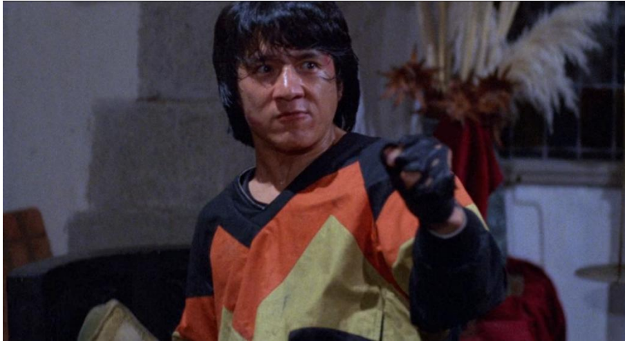
Abb. 13: Thomas richtet sich wieder auf

Thomas erhebt sich, reißt dabei seine Augen weit auf und lässt seinen Gegner nicht aus dem Blick. Hier finden wir ein gutes Beispiel dafür, wie die Kameraführung einen expressiven Gesichtsausdruck und eine angespannte Körperhaltung zusätzlich unterstreichen kann. Während sich Jackie Chans Charakter in diesem Moment aufrichtet, folgt die Handkamera exakt der Bewegung von seinem Körper und richtet sich aus, um ihn an der gleichen Stelle im Bildrahmen zu positionieren, mittig auf der linken Seite. Auffällig ist auch, dass Thomas für einen Moment größer zu werden scheint, weil er sich aufstellt und dabei über den oberen Rahmen des Bildes hinauswächst.