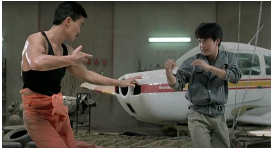
Abb. 19: Szene aus "Righting Wrongs"

offene Baustellen sind, wird sie schon jetzt regelmäßig für Flohmärkte und ähnliche Großveranstaltungen genutzt. Die zuständige Organisatorin des Vereins war begeistert von unserer Idee und unserem Engagement, sodass wir eine schnelle Zusage erhielten. Außerdem wurde uns erlaubt, diverse vorhandene Tische und Bänke für unser Flohmarktset zu benutzen.