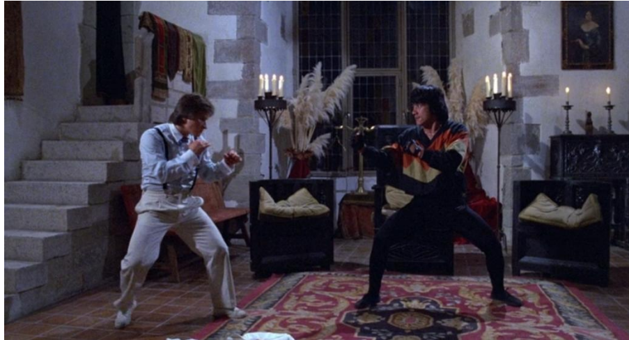
Abb. 10: Die Kontrahenten gehen vor dem Kampf in eine Pose

In einem Fullshot sehen wir die beiden Kontrahenten und ihre Haltungen. Benny Urquidez in einer Haltung, die einem Boxer gleicht, bullig. Jackie Chan dagegen in einer weiten Haltung, die durch seine enganliegenden Leggings nur weiter betont wird. Gleichzeitig sehen wir diverse Elemente dieses Raumes, die allesamt gut ausgeleuchtet sind und eine Rolle in den Kampfsequenzen spielen – die Treppe, die Kerzenständer, die Sessel im Hintergrund.