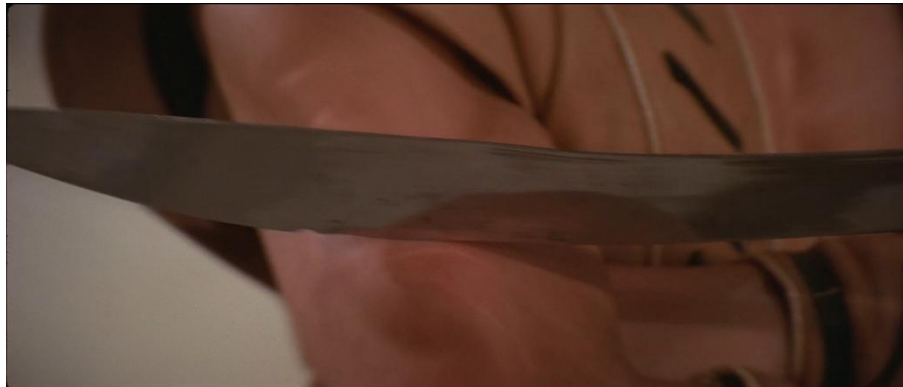
Abb. 7: Das Schwert wird von Tao Lis Haut aufgehalten

Es folgt ein unmittelbarer Schnitt zurück zum Kampf. Eine Nahaufnahme präsentiert das vor Anstrengung zusammengezogene Gesicht von "Kröte". In einem Reißschwenk wechselt der Fokus plötzlich auf den Arm des Kämpfers. Das Schwert trifft die Haut von "Kröte", aber wird von seinem angespannten Körper aufgehalten.