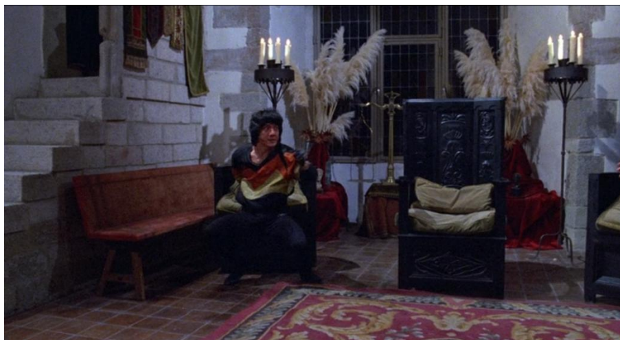
Abb. 11: Thomas wird durch eine Attacke in einen Sessel geworfen

In einem Fullshot sehen wir die beiden Kontrahenten und ihre Haltungen. Benny Urquidez in einer Haltung, die einem Boxer gleicht, bullig. Jackie Chan dagegen in einer weiten Haltung, die durch seine enganliegenden Leggings nur weiter betont wird. Gleichzeitig sehen wir diverse Elemente dieses Raumes, die allesamt gut ausgeleuchtet sind und eine Rolle in den Kampfsequenzen spielen – die Treppe, die Kerzenständer, die Sessel im Hintergrund.