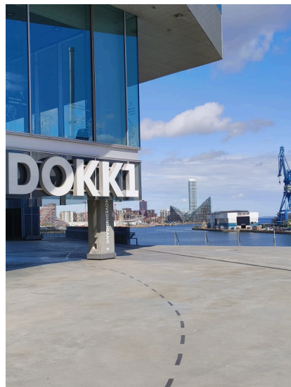
Abb. 1 Das Dokk1 im Hafengebiet (Geest:2024) 4

Das Dokk1 wurde 2015 fertiggestellt und erhielt unter anderem 2017 einen International Design Award (IDA) ( Lammhults Biblioteksdesign A/S 2018 ). Das Gebäude umfasst rund 33.600 m 2 und beherbergt neben der Zentralbibliothek auch den Bürger*innen Service, sowie das Stadtarchiv Aarhus und ein eigenes Café ( Schmidt Hammer Lassen 2025 ). Es liegt direkt an der Uferpromenade und bietet durch seine Glasfassade einen Rundumblick auf die Umgebung. Um das Gebäude herum befinden sich großzügige Spielflächen für Familien mit Kindern ( Østergaard 2025 : 92–94).