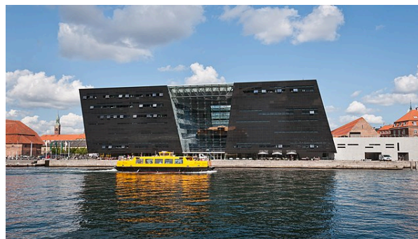
Abb.3 Der Black Diamond (Herzog:2014) 24

Die Bibliothek ist ein Dritter Ort, denn sie schafft eine Zugänglichkeit durch die langen Öffnungszeiten, bietet multifunktionale Räume und ein niedrighschwelliges Kulturangebot für verschiedene Zielgruppen.