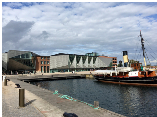
Abb. 2 Die Kulturværftet Helsingør 13

Die Hansestadt Helsingør beherbergt nicht nur das bekannte Schloss Kronborg, das als Schloss Elsinore aus Shakespeares Werk Hamlet weltberühmt ist, sondern auch die Kulturværftet Helsingør ( Britannica Editors 2019 ). Das moderne Kulturzentrum wurde 2010 eröffnet, um die Hafengegend der Stadt zu beleben. Das Gebäude erstreckt sich über rund 13.000 Quadratmeter und zieht jährlich mehr als 700.000 Besuchende an. Es liegt an der Uferpromenade von Helsingør und ist nah am Schloss Kronborg. Das Kulturværftet ist ein beliebter Treffpunkt der Bürger*innen der Stadt und bietet viele verschiedene Veranstaltungen an. 14