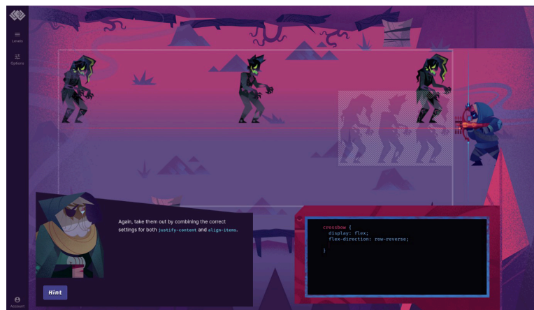
Abbildung 1: Flexbox Zombies Level 3-11. Quelle: Flexbox Zombies (2017): PC [Videospiel], o.O.: Dave Geddes

Flexbox Zombies ist ein Spiel, das kosten- und werbefrei auf der Webseite flexbox-zombies.com spielbar ist. Jedoch wird zum Spielen ein Konto bei Mastery Games gebraucht. Theoretisch kann es auf PCs, Tablets und Mobiltelefonen gespielt werden, jedoch empfiehlt sich das Spielen auf einem großen Bildschirm und mit Tastatur, da es sonst unübersichtlich und gedrängt wirkt.